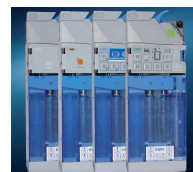
6 Tuben Kassette